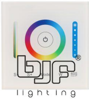
CONTROLADOR DE PARED 1 ZONA RGCCT