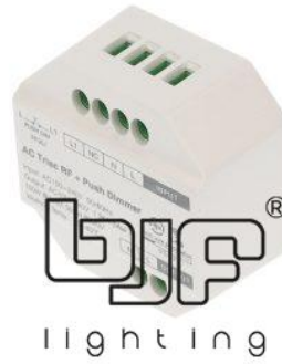
REGULADOR 230V 300W SERIE SMART MONOCOLOR