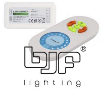
MANDO+CONTROLADOR 1 ZONA MONOCOLOR