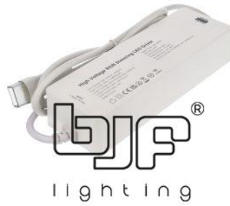
CONTROLADOR PARA TIRAS LED 230V 400W 2.4G RF RGB