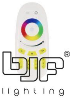
MANDO TACTIL 4 ZONAS RGB-RGBW