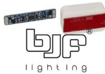
SENSOR DE MANO O PUERTA 12-24VDC 3A MONOCOLOR