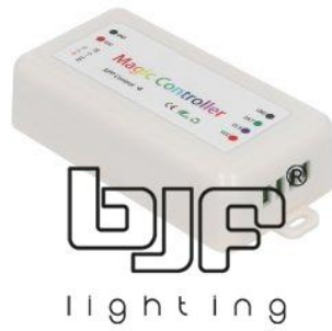
CONTROLADOR LED SPI BLUETOOTH 2048 PIXEL DC5-24V RGBW