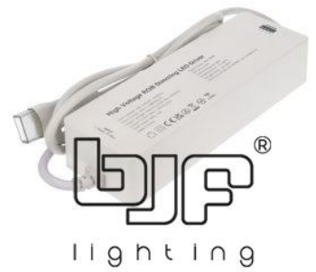
CONTROLADOR PARA TIRAS LED 230V 400W 2.4G RF RGB