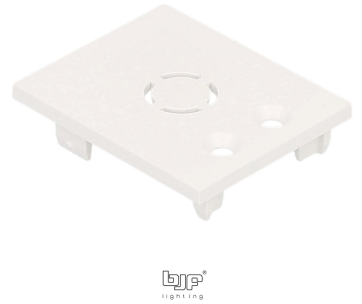
TAPA FINAL BLANCO PARA CARRIL MAGNETICO 047-4600 / 047-4601