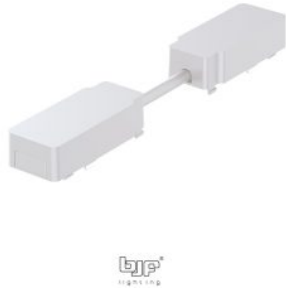
UNION FLEXIBLE CARRIL MAGNETICO CABLE CORTO 25mm BLANCO MATE