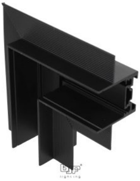
UNION EN L NEGRO PARA CARRIL MAGNETICO 047-4600 / 047-4601