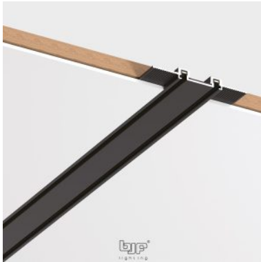
CARRIL MAGNETICO EMPOTRABLE SLIM NEGRO MATE 2M