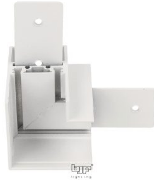
UNION EN L BLANCO PARA CARRIL MAGNETICO PROFUNDO 047-4500 / 047-4501